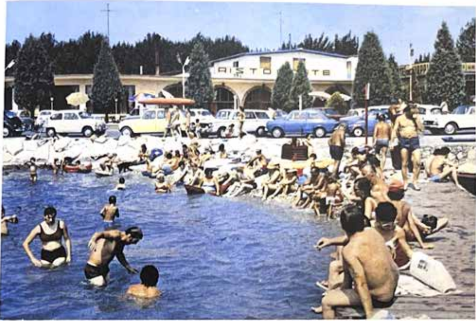
La spiaggia del Campeggio dei Pioppi nel 1970

palude in un campeggio. Questa era una delle cose che lo riempivano di soddisfazione.