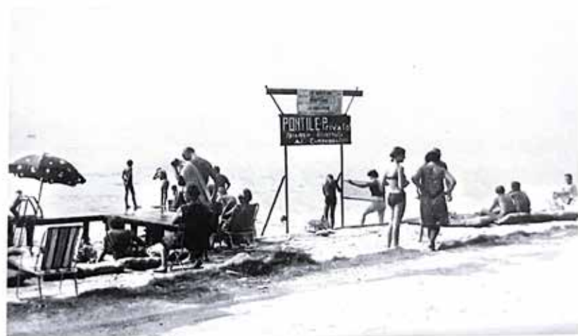
Il pontile privato dei Pioppi nel 1960