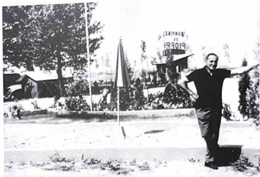
Mio papà al Campeggio dei Pioppi nel 1962. Sul terreno in affitto dai confinanti c'è già una piscina e uno spazio adibito a spiaggia