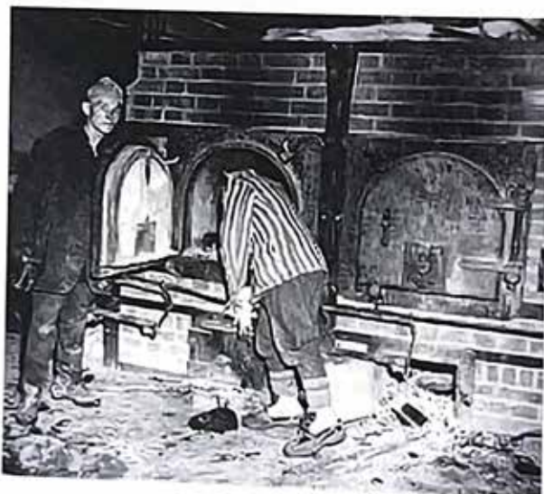
Uno dei forni crematori di Mauthausen durante l'attività del lager