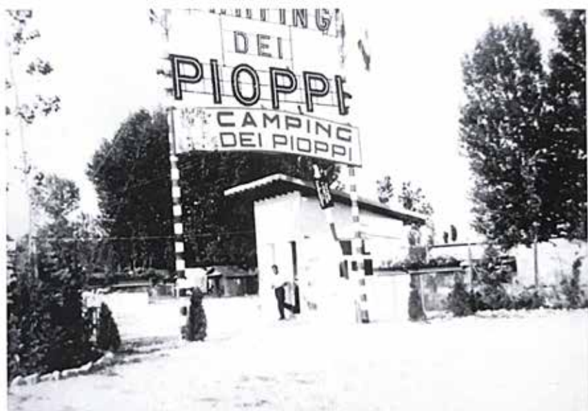
L'entrata del Campeggio dei Pioppi nel 1959