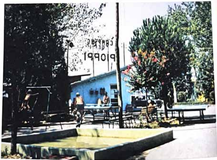
La prima piscina per bambini vicina a quella degli adulti costruita all'inizio degli anni Sessanta in muratura con altri giochi per bambini e ragazzi