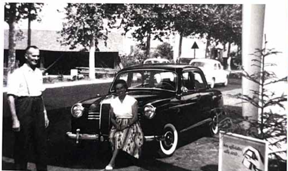
La famiglia Burgstaller all'Albergo Fortuna all'inizio degli anni Cinquanta