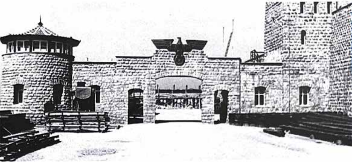
Il minaccioso ingresso della fortezza lager di Mauthausen in Austria

cio, annegati a forza nelle fogne, gettati ancora vivi nei forni crematori, sbranati dai cani delle SS. I più fortunati venivano fucilati in massa o con un colpo alla nuca. Molti si toglievano la vita gettandosi sul filo spinato con l'alta tensione.