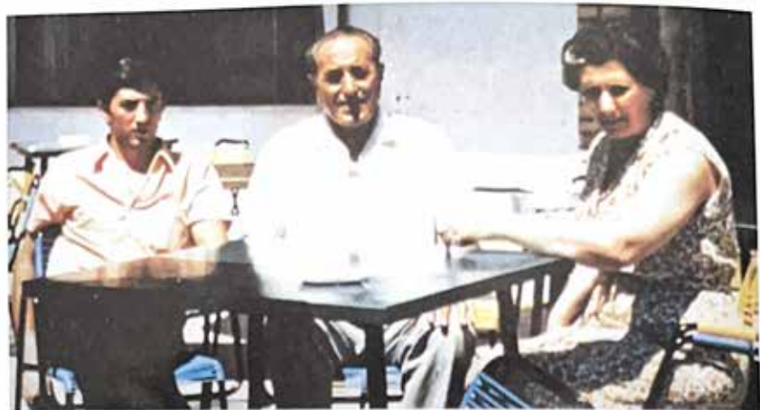
Metà anni '60: io, mio papà e mia mamma davanti al ristorante dei Pioppi