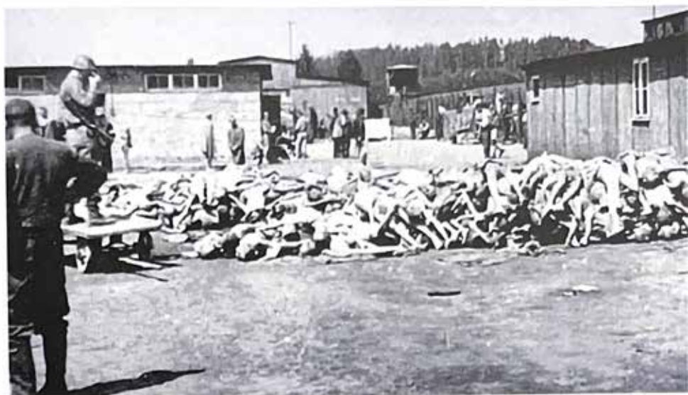
Una catasta di cadaveri di prigionieri del lager di Mauthausen, come li hanno trovati i liberatori americani