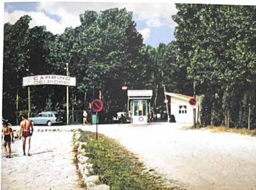
L'entrata del Campeggio dei Pioppi all'inizio degli anni Sessanta

I lavori di bonifica prevedevano canalizzazioni per l'acqua piovana, tubazioni a servizio del Comune che dalla Statale 11 doveva portare fino al campeggio l'acqua potabile, l'allacciamento con la corrente elettrica poiché in quell'area c'era solo il campeggio, la costruzione di fognature costruendo vasche perdenti con fondo aperto di ghiaia per far defluire l'acqua e che, di tanto in tanto, venivano svuotate.