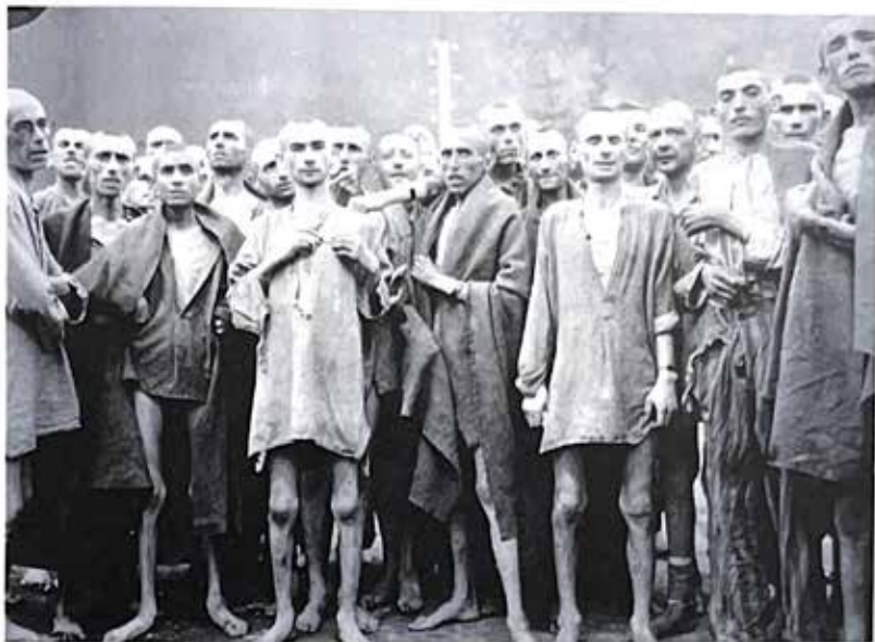
Un gruppo di prigionieri scampati alla morte, fotografati dagli americani dopo la liberazione del campo il 5 maggio del 1945

titudine e per la sua prestanza fisica. Per l'affidabilità di cui godeva, conduceva anche i camion che trasportavano esplosivi di notte da Peschiera ai vari depositi che c'erano nella zona fino all'Isola di Trimelone, davanti a Malcesine.