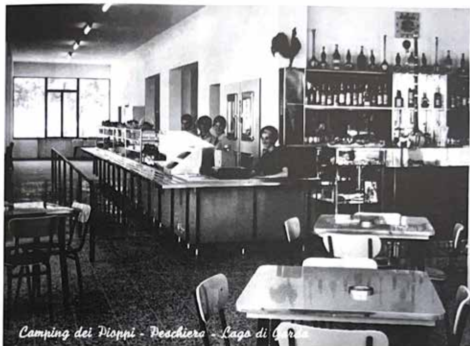
La tavola calda Campeggio dei Pioppi in una cartolina postale del 1961