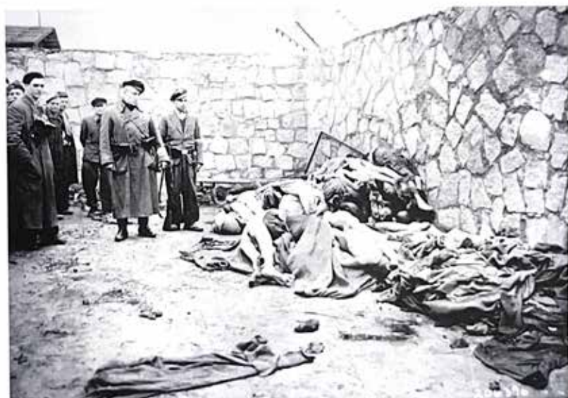
Cadaveri accatastati di prigionieri morti a Mauthausen