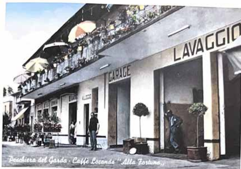
L'albergo Fortuna negli anni Sessanta

poi iscritto, dopo un esame di ammissione, alle medie alle Stimate, scuola prestigiosa della città.