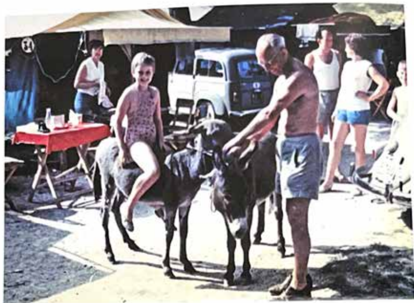
La vita ai Pioppi all'inizio degli anni Sessanta